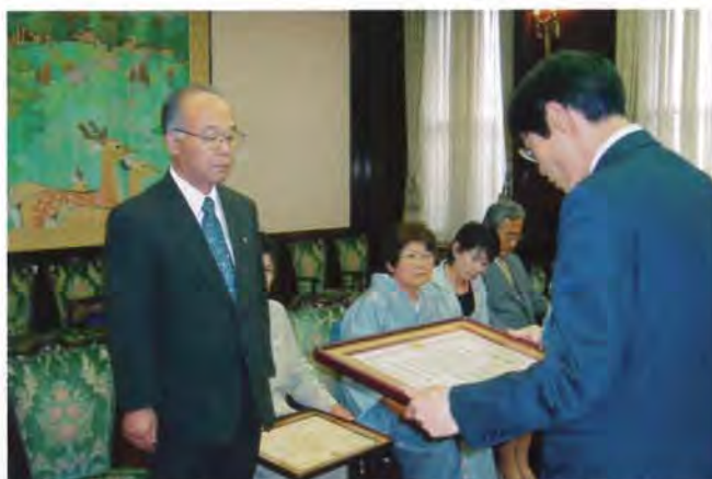
鎌仲県厚生部長よりご遺族の方へ伝達 2006年5月24日