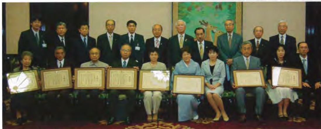
厚生労働大臣感謝状伝達式（県庁特別室において） 2006年5月24日