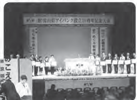
写真は10周年記念大会(平成14年)