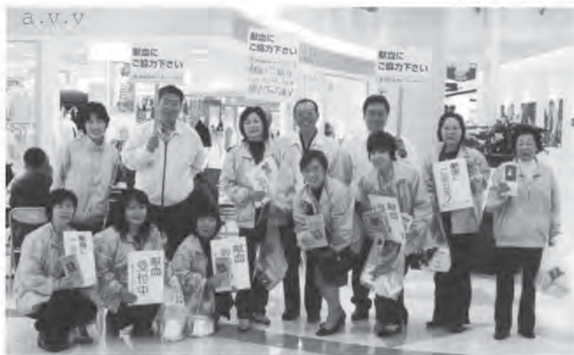
平成17年11月6日 ファボーレにて登録活動