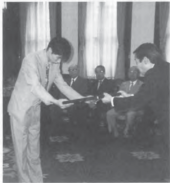
県厚生部長からの厚生大臣感謝状の伝達模様とご遺族の皆様 (於 県庁特別室)