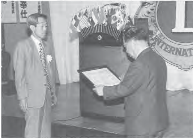
(ガバナー公式訪問にて アイバンク協力金を頂く)