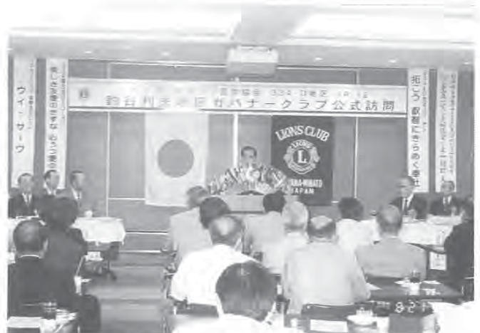
(ガバナー公式訪問に於いて ごあいさつ)