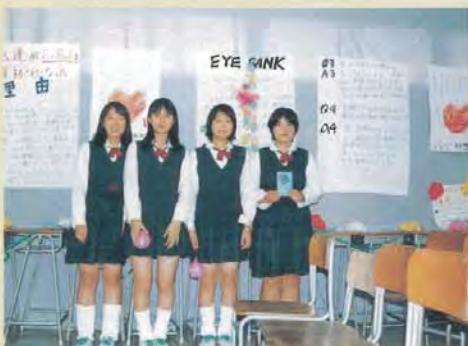
学園祭において放送部並びに二年生の皆さんがアイバンクについての学術展示をしてくださいました。

最初、番組作りのテーマ探しの中で、私が担任していたクラスの生徒の話をしてやったことが興味を持つきっかけとなったようです。いろいろな方から話が聞けて部員達は大変勉強になったようです。この体験がこれからの他の人達に話せるようになってアイバンクに対して興味を持ってくれる人が増えてくれればと思っています。