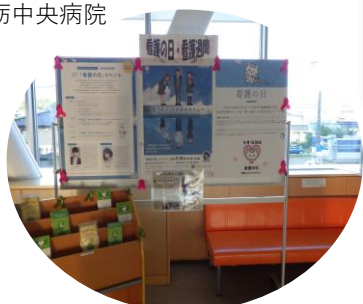
かみいち総合病院