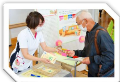
公立南砺中央病院