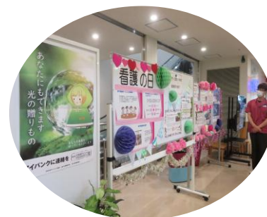
金沢医科大学氷見市民病院