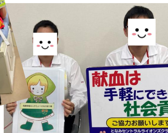
◀となみセントラルLC：富山県立砺波工業高等学校の生徒さん▶