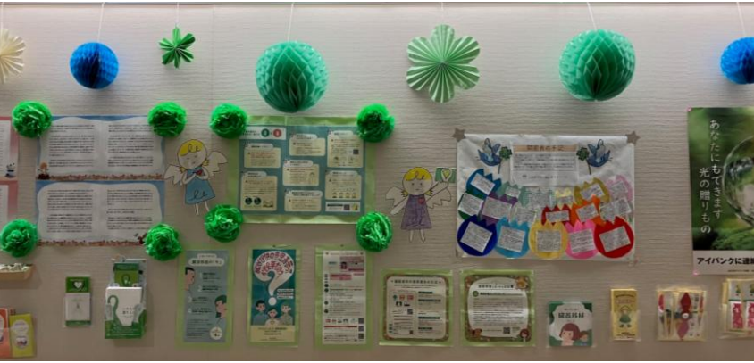
≪ 富山県立中央病院 9/30～10/31まで掲示 ≫

グリーンリボンは、世界的な移植医療のシンボルマークです。成長と新しい命を意味するグリーンで、ギフト・オブ・ライフ(いのちの贈り物)によって結ばれたドナーとレシピエントの命のつながりを表現しています。毎年様々なグリーンリボンキャンペーンが展開されています。グリーンリボンキャンペーンは、多くの人に、移植医療について知ってもらい、臓器のご提供者(ドナー)に感謝するとともに、移植で救われた命の素晴らしさについて知ってもらうイベントです。10月の臓器移植普及推進月間を中心にいろいろな取組みが予定されています。アイバンクも、10月10日が「目の愛護一」になります。今年も、公益財団法人富山県移植推進財団の取組みに参加させていただきました。