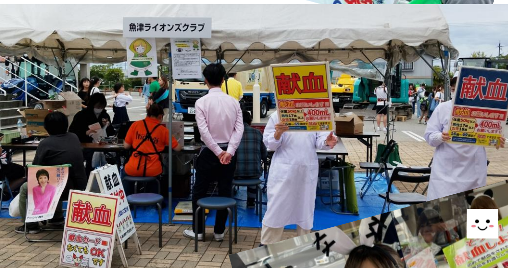
◀魚津LC：ありそドームにて▶