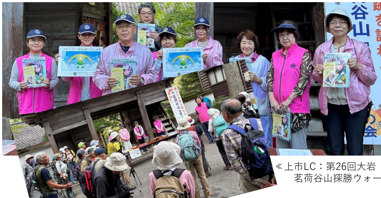
《 上市LC：第26回大岩 茗荷谷山探勝ウォークの会にて 》