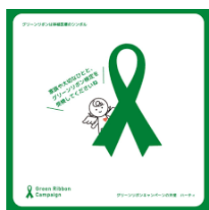
《済生会高岡病院》《富山ろうさい病院》《かみいち総合病院》

今年は、県内の12か所の病院にて アイバンク啓発掲示のご協力をいただきました。 本当にありがとうございました！