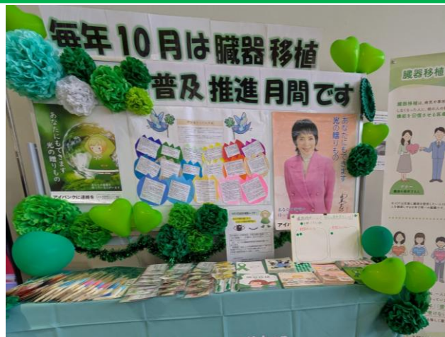
《厚生連高岡病院 10/28～10/30まで掲示》