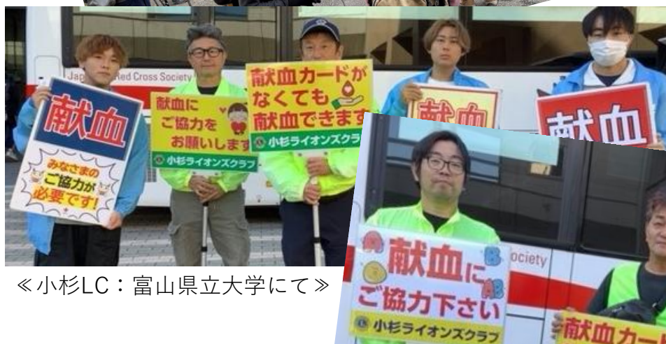
《 小杉LC：富山県立大学にて 》