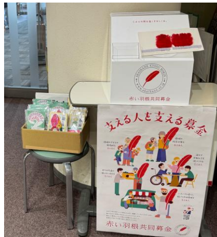
≪ 砺波総合病院 10/30～10/31まで掲示 ≫