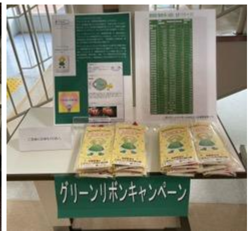
≪ 厚生連滑川病院 10/20～10/31まで掲示 ≫