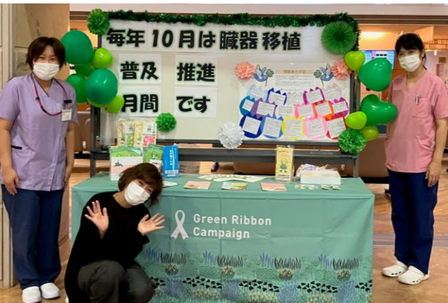
≪ 高岡市民病院 ≫