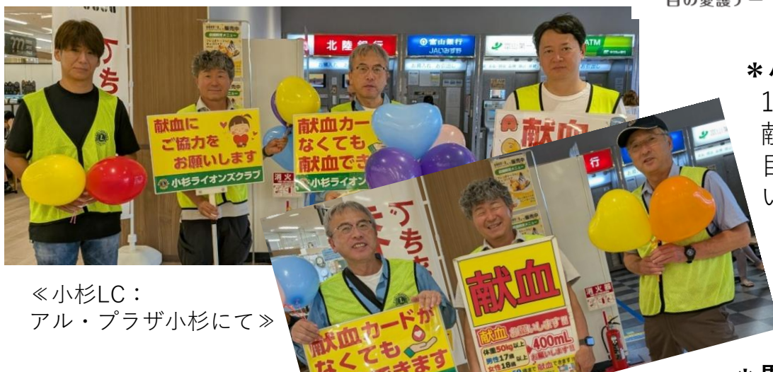
◀小杉LC： アル・プラザ小杉にて▶