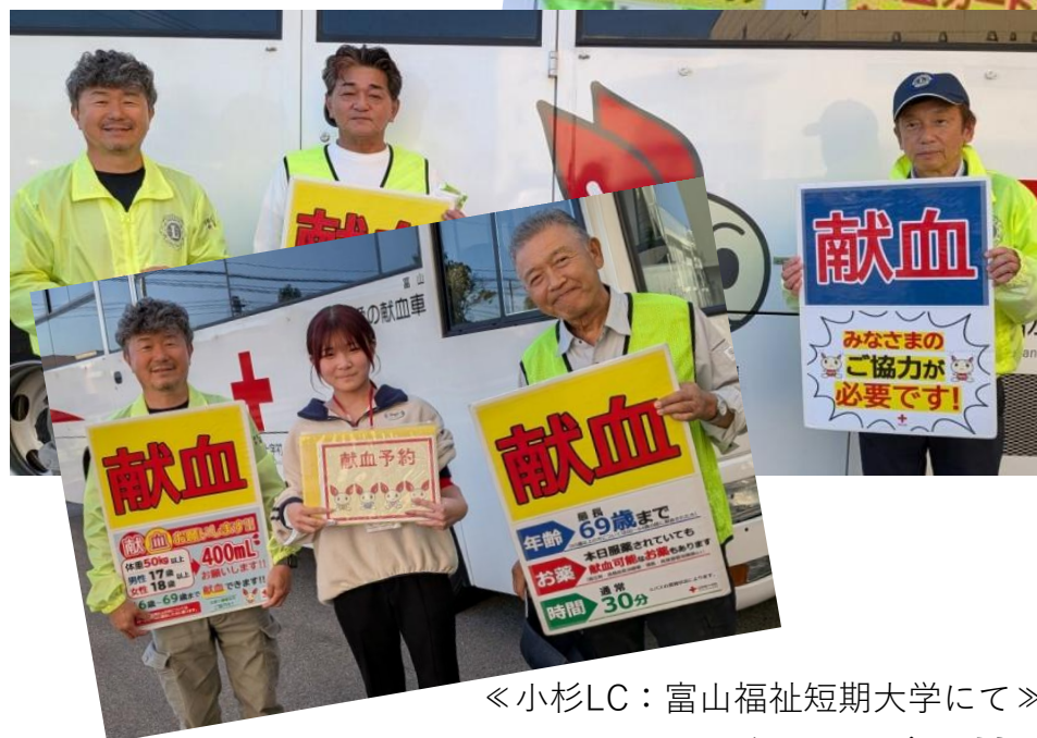
《 小杉LC：富山福祉短期大学にて 》