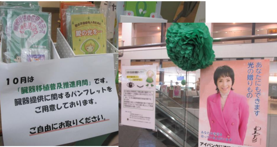
≪ 富山赤十字病院 10/10～10/17まで掲示 ≫