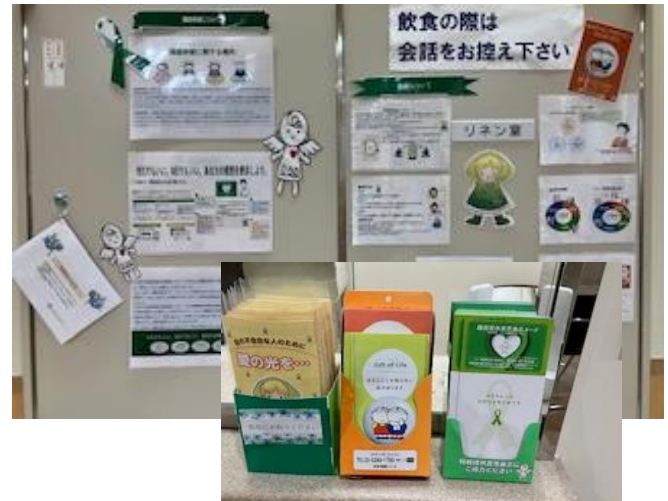
≪ 北陸中央病院 10/9～10/31まで掲示 ≫