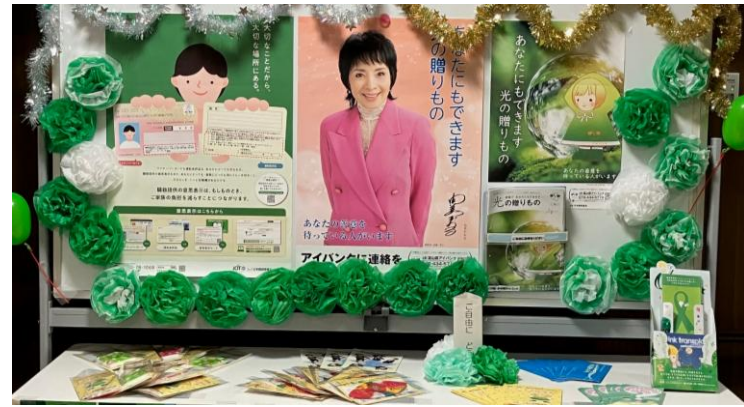
≪ 富山大学附属病院 10/20～10/30まで掲示 ≫